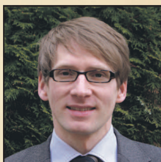
Thomas Stelzer Bestattungen Jückmann