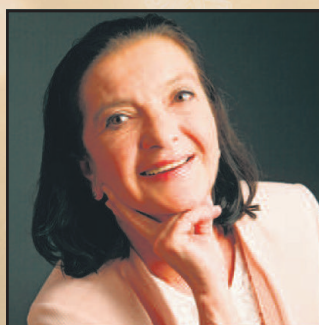
Regila Radix-Dorozala Versicherungsbüro Adminova