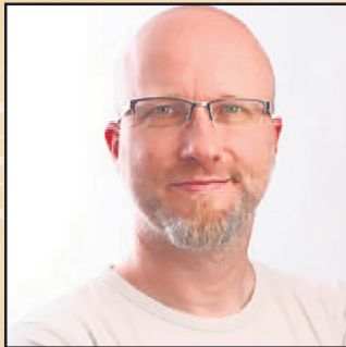
Christian Günther Atelier Tag Eins