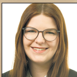
Lina Marx Kreissparkasse Stade