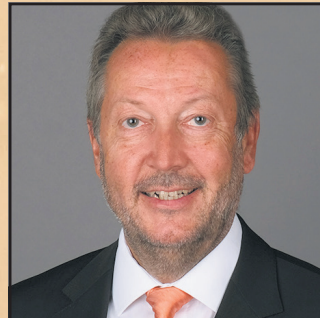
Willem Klie Volksbank Geest eG