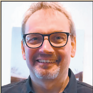
Arno Eckstein Classic Tankstelle