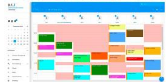
Bisherige Auftragsverwaltung im Vergleich mit neunden digitalen Werkzeugen