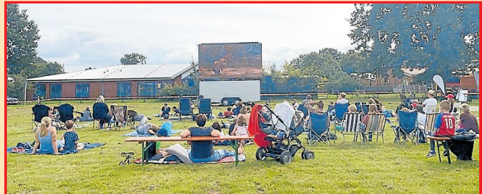
Premiere von Apensens Open-Air-Kino im Bürgerpark im vergangenen Jahr.

Sponsoren erhalten je nach Beitrag Freikarten, Nennung des Unternehmens und Logos auf der Leinwand sowie die Möglichkeit zur Aufstellung von Werbemitteln. Zusätzlich können bei höheren Beträgen weitere Werbemaßnahmen wie die Präsentation von Imagefilmen und Werbeprints auf Plakaten vereinbart werden. Weitere Informationen zur Jugendkonferenz Apensen und ihrer Arbeit sind zu finden unter: https://juko-apsen.jimdofree.com .