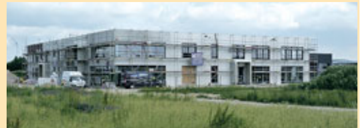
Bald fertig: die neue Produktionshalle samt Ladengeschäft und Café der Bäckerei Schrader im Gewerbegebiet.

recht an der engen Kurve der Stader Straße gegenüber der Kirche liegt, eine neue Tagespflegeeinrichtung mit seniorengerechten Wohnungen gebaut wird. Und genau dort wird die Hauptumgehungsstraße während der Sperrung der Buxtehuder Straße sein. (iha)