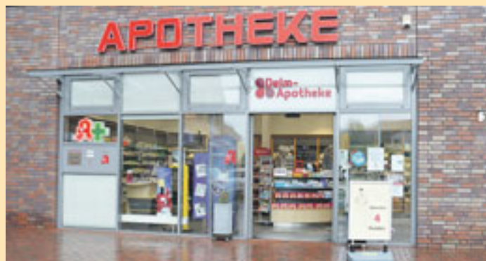
Vor 5 Jahren ist die Delm- Apotheke in den modernen Neubau umgezogen

fang an sehr willkommen und heimisch in der Region. Das Jubiläum ist Anlass für sie, einmal Danke zu sagen: „Ich möchte mich an dieser Stelle bei allen Kund*Innen für die langjährige Treue und das mir entgegengebrachte Vertrauen bedanken. Ein ganz großer Dank gilt aber auch meinen tollen Mitarbeiter*Innen, die mir tagtäglich zur Seite stehen und zusammen mit mir alle Herausforderungen meistern.“