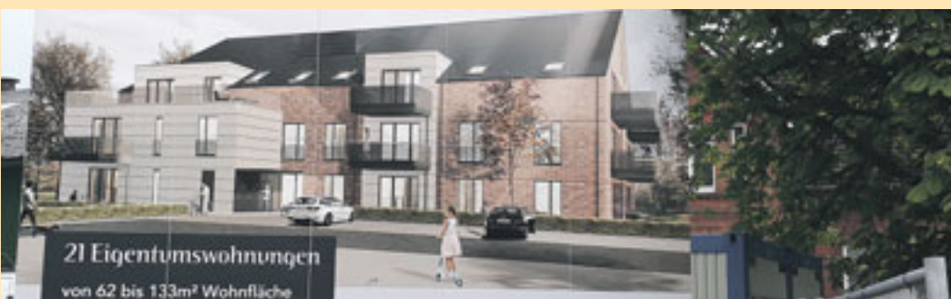
21 Eigentumswohnungen von 62 bis 133m 2 Wohnfläche