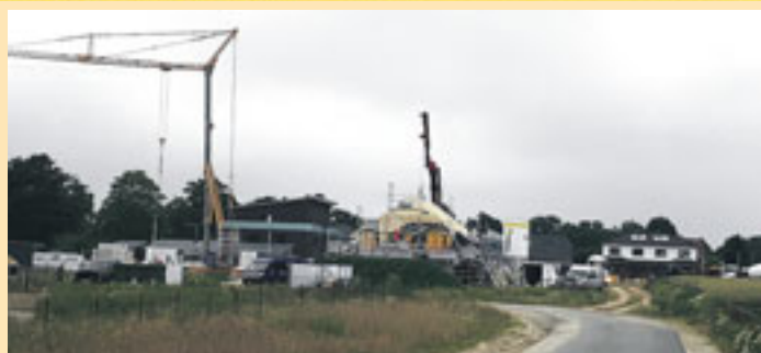
Apensen im Aufwind: nicht nur das Beckdorfer Baugebiet entwickelt sich rasant.

Stabilisierung und Weiterentwicklung heben“, so Radix-Dorozala und Klie. Ein Wermutstropfen allerdings bleibt: Der Ausbau der Buxtehuder Straße ab August, der den Apensern ein Jahr lang die komplette Sperrung der Straße und viele Umwege auch zur Autobahn zumutet, da die direkte Verbindung von und nach Buxtehude voraussichtlich bis September 2022 gekappt ist. Die Erreichbarkeit von nahezu 30 Gewerbetreibende wird stark eingeschränkt sein. Vor dem Hintergrund der Behinderungen, die mit dem Ausbau einhergehen, zeigt sich der Gewerbeverbund enttäuscht über die „wenig transparente und frühzeitige Informationspolitik“ der Kommune. Man hätte sich umfassendere und klarere Information der Bürger und auch der Gewerbetreibenden gewünscht, machte der Gewerbeverbund deutlich. Man erwarte jetzt, dass die Verwaltung umgehend ein Konzept für gangbare Ausweichstrecken vorlegt, damit die inner-