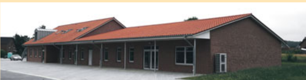
Im August öffnet das Nahversorgungszentrum Sauensiek mit Dorfladen, Arztpraxis und Mehrzweckraum seine Pforten.