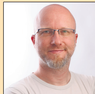
Christian Günther Atelier Tag Eins