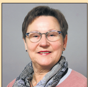
Helga Tanke Postagentur