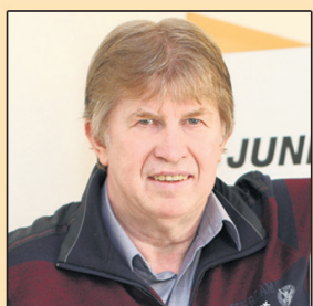
Bernd Elmers Sanitär- u. Heizungstechnik