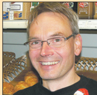
Arno Eckstein Classic Tankstelle