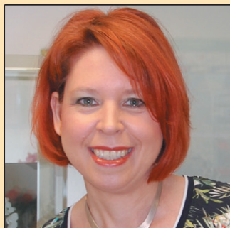
Susanne Janz Dental Atelier