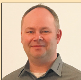
Volker Mehrkens Ing.-Büro für Fahrzeugtechnik