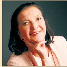
Regila Radix-Dorozala Versicherungsbüro Adminova

Und eine ganz große Bitte in unser aller Interesse: Halten Sie bitte Abstand und nutzen Sie Ihren Mundschutz!